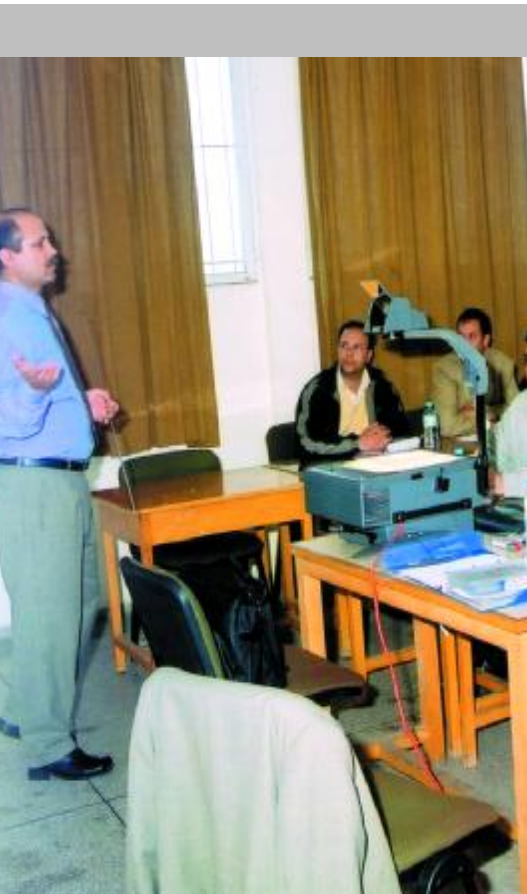
Maintenir la formation professionnelle comme base de l'excellence

liaison avec les entités concernées trois opérations de promotion au cours de l'année 2002 :